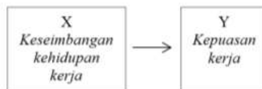
Gambar 1. Kerangka konseptual

Variabel pada penelitian ini yaitu variabel independen (X) berupa keseimbangan kehidupan kerja, dan variabel dependen (Y) berupa kepuasan kerja. Ilustrasi kerangka konseptual dapat dilihat pada Gambar 1.